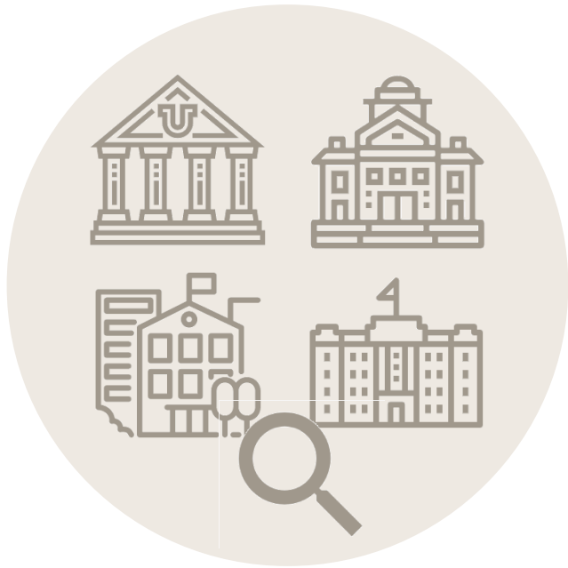
1. 대학참여여부 확인