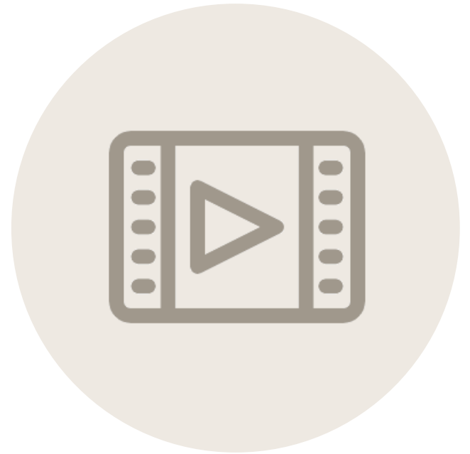
3. 온라인사전교육 이수