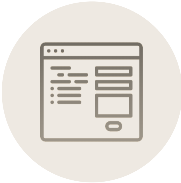
2. 신청서 작성