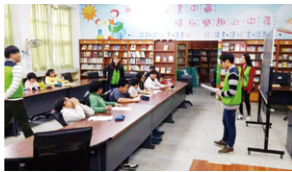
다문화사역 영어캠프 국내현장학습