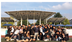
하나가 되는 공동체