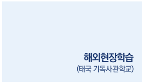
해외현장학습 (태국 기독교사관학교)